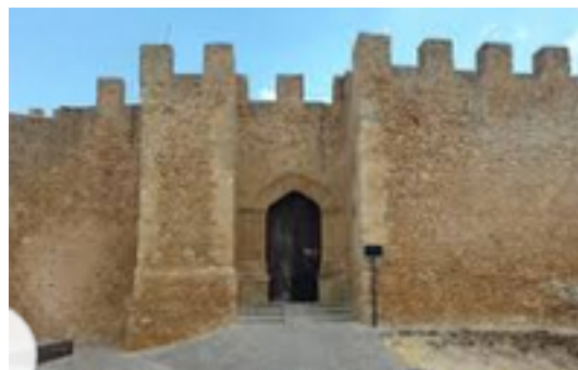
Castello Chiaramontano di Naro

Viene considerata come la città del Barocco, infatti visitandola si ha la possibilità di scoprire numerose tracce delle sue origini medievali, rappresentate principalmente dal suo magnifico castello.