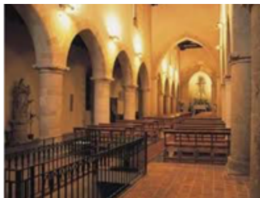
CHIESA DI S. CATERINA D'ALESSANDRIA |

La Chiesa di Santa Caterina è invece in stile gotico e conserva numerose opere d'arte, tra cui un preziosissimo fonte battesimale scolpito.